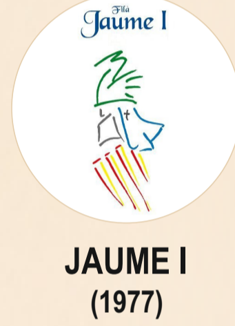
JAUME I (1977)