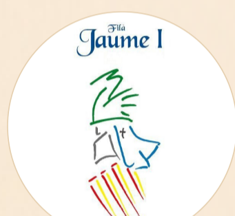
JAUME I (1977)