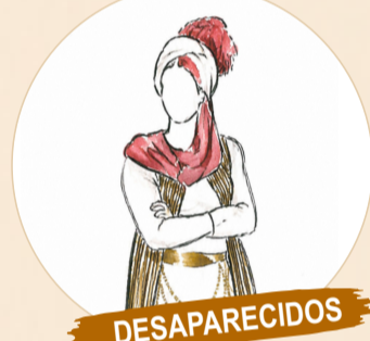
DESAPARECIDOS MOSSÀRABS (1979-1980)