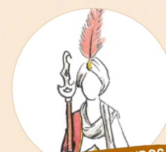
DESAPARECIDOS BUCANERS (1977-1986)