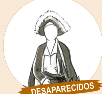
DESAPARECIDOS CORSARIS (1992-2018)