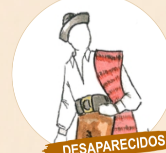
DESAPARECIDOS BANDOLERS (1978-1979)