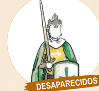
DESAPARECIDOS CREUATS (1980-1983)