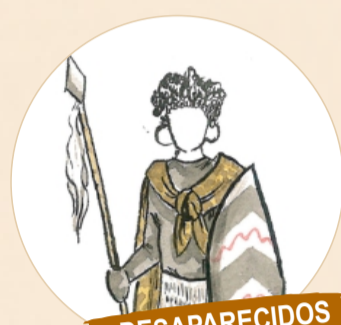
DESAPARECIDOS CANIBALS (1976-1992)